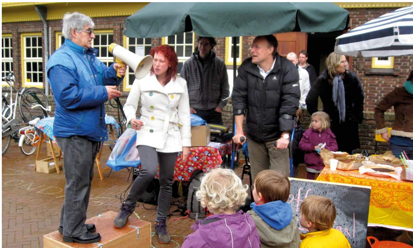
Zeepkistactie voor het Zonneplein